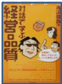
対話で学ぶ経営品質 (生産性出版)

大手流通系企業を経て、1989年、公益財団法人 日本生産性本部にコンサルタント給費生として最年少で入社。以来、経営コンサルタントとして30年にわたり、上場企業から中堅企業まで約200社の経営コンサルティング、数万人の研修を実施。コンサルティングと研修を融合させた、独自のワークショップは、参加者自身の課題を題材に進めるため実践的であり、リピート率は8割を超える。研修テーマは、リーダーシップ、ファシリテーション、プレゼンテーション、講師養成など。1998年以降、卓越した企業を表彰する「日本経営品質賞」の審査員として、その後、埼玉県・徳島県経営品質賞判定委員として、経営品質の普及推進活動に従事している。2015年より、「人前で教える技術」を磨きあう、「ライブ講師®実践会」を主催。数多くの講師、コンサル、ビジネスリーダーが参加し、ともに学びを続けている。