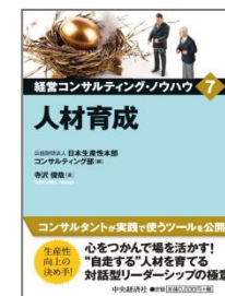
人材育成 (中央経済社)