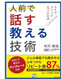
人前で話す・ 教える技術 (生産性出版)