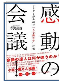
感動の会議！ (ディスカヴァー21)