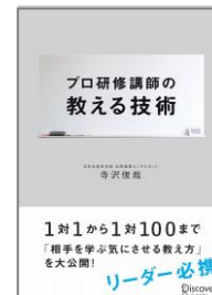
プロ研修講師の 教える技術 (ディスカヴァー21)